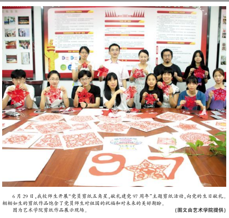
6月29日,我校师生开展“党员剪纸五角星,献礼建党97周年”主题剪纸活动,向党的生日献礼。栩栩如生的剪纸作品饱含了党员师生对祖国的祝福和对未来的美好期盼。 图为艺术学院剪纸作品展示现场。(图文由艺术学院提供)

本次评卷工作历时 9 天,来自省内普通高校、各地市中学和地方教研中心的近 300 名教师参加了评卷工作。